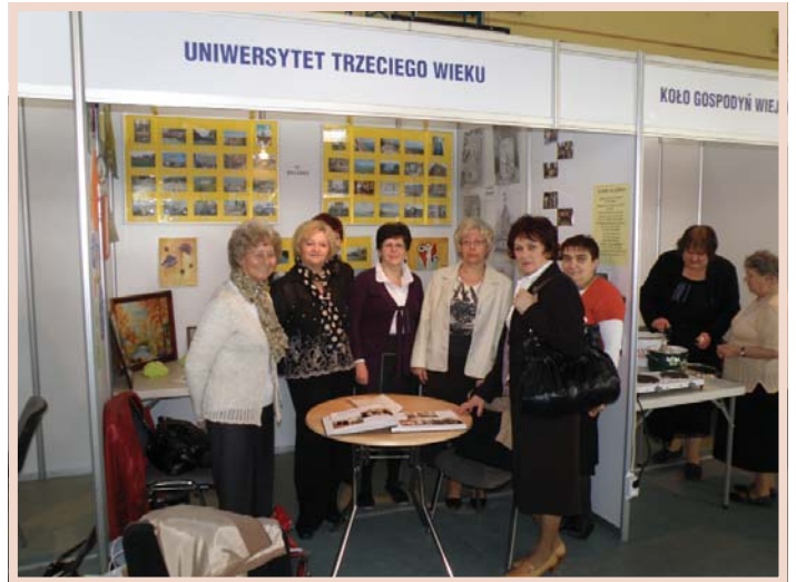
Przedstawicielki strzelińskiego Uniwersytetu III Wieku.