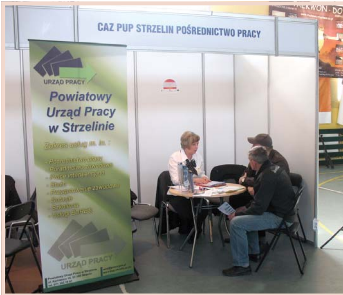
Zainteresowani mogli skorzystać z usług pośrednika pracy, który udzielał informacji na temat ofert i warunków pracy w kraju i za granicą.