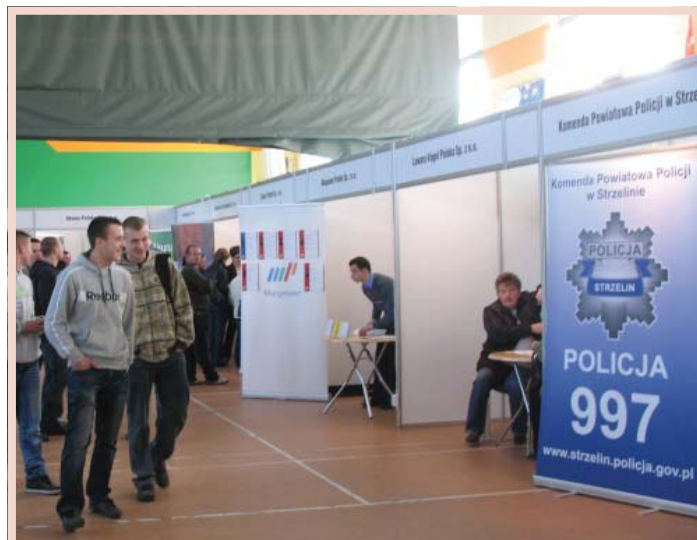
Wśród pracodawców prezentowała się m.in. Komenda Powiatowa Policji w Strzelinie.

Przedstawiciele każdej firmy zaprezentowali swoje oferty pracy osobom zainteresowanym podjęciem zatrudnienia.