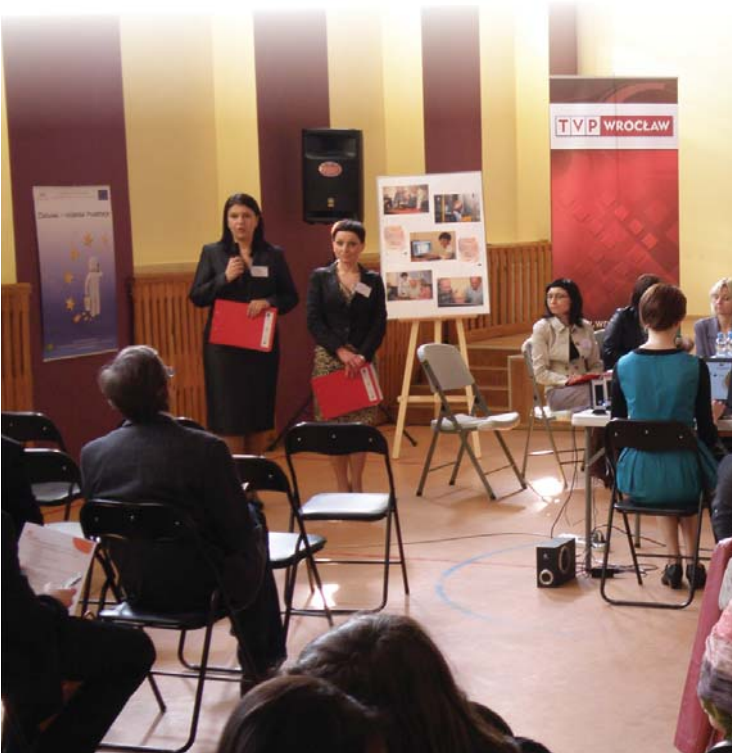
Panel dyskusyjny na temat „Pracownik 50+. Przełamywanie barier na rynku pracy”.