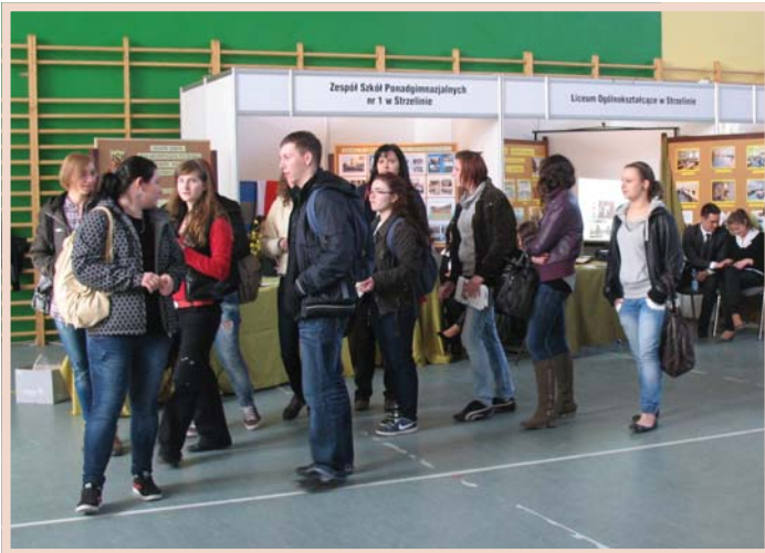
Swoją ofertę zaprezentowały szkoły ponadgimnazjalne z powiatu strzelińskiego.