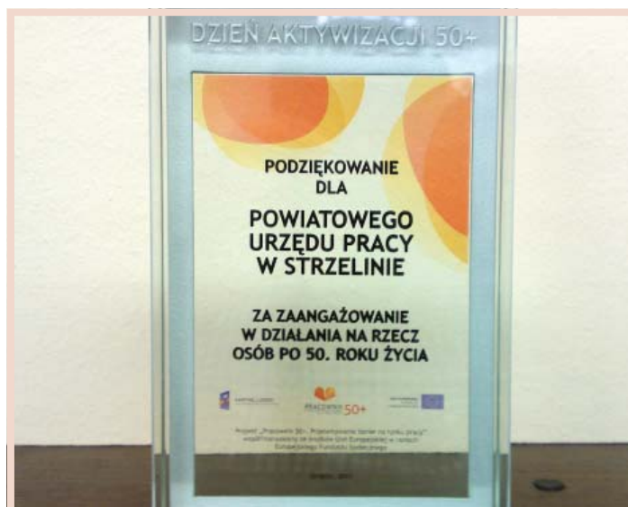
W związku z Dniem Aktywizacji 50+ swoją ofertę przedstawiły koła gospodyń wiejskich i Uniwersytet III Wieku.

Targom Pracy po raz pierwszy towarzyszył Dzień Aktywizacji 50+ organizowany w ramach projektu „Pracownik 50+ Przełamywanie barier na rynku pracy”. Odwiedzający mieli szansę porozmawiać m.in. z przedstawicielami Uniwersytetu III Wieku i innych instytucji, które pomagają odnaleźć się osobom po 50 roku życia na lokalnym rynku pracy. Uczestnicy Dnia Aktywizacji 50+ skorzystali z panelu dyskusyjnego na temat aktywizacji osób po 50 roku życia, podczas którego wymienili się doświadczeniami i pomysłami na temat jak żyć aktywnie po 50 roku życia. Pracodawcy uczestniczyli w szkoleniu, którego celem było przełamanie barier w zatrudnianiu osób po 50 roku życia.