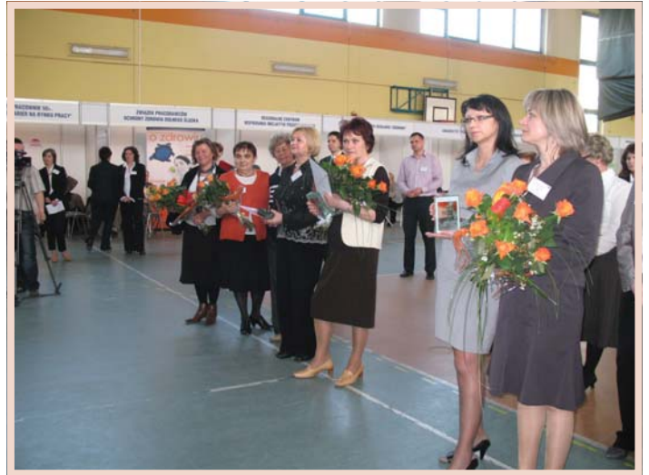
Wręczenie nagród laureatom konkursu „50+ NA PLUS”